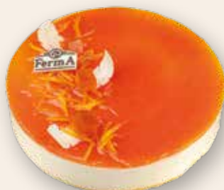
Апельсиновый 2500 Р (1190 г)