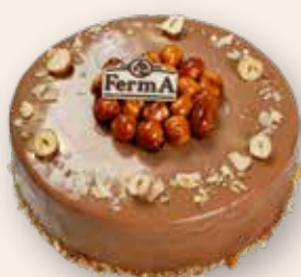
Орехово-карамельный 2100 Р (900 г)