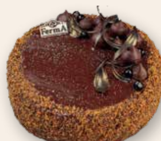
Маковый торт 2400 Р (1250 г)