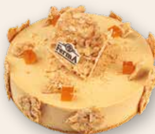
«Жареный шоколад» 3300 Р (1140 г)