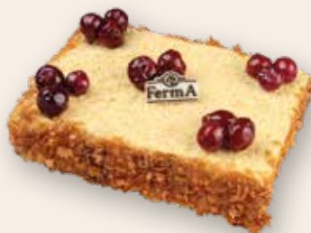
Сметанник 2100 Р (1000 г)