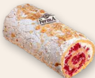
Малиновый рулет-торт 2400 Р (1000 г)