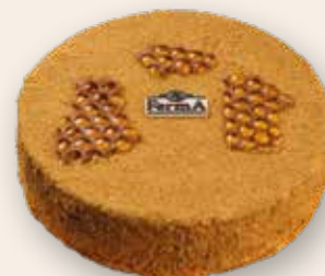
Медовик карамельный 2400 Р (1200 г)