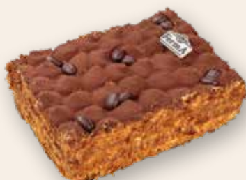
Тирамису 2500 Р (1000 г)