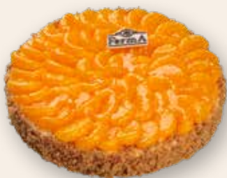
Чиз-кейк 2800 Р (1400 г)

У нас можно заказать торт любого размера и веса, а также дополнительно оформить его свежими ягодами и сделать поздравительную надпись на табличке из шоколада.