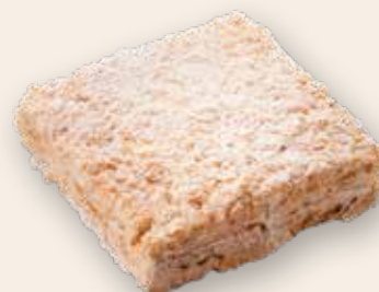
Наполеон 2300 Р (1000 г)