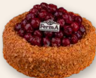
Шоколадный с вишней 2800 Р (1500 г)